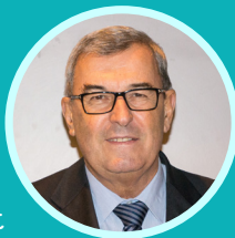
Le Président Jean-Paul Bacquet

Il s'agit d'un programme incitant à l'amélioration et la réhabilitation de logements en milieu rural ou urbain. C'est donc un dispositif territorialisé destiné à l'amélioration de l'habitat privé.